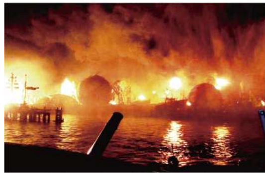
市原市の石油タンク火災の消火活動 (H23版 消防白書より)

10月17日、千葉県市原市のコスモ石油の連続ガススタンク爆発(2011年3月)への対応を視察しました。爆発のきっかけは、地震の影響で石油タンク本体ではなく周囲のパイプラインが損傷したこと。そのためガスが漏れて高温の施設の近くで発火。そこからタンク本体に延焼し爆発、連続爆発の大規模災害へと拡大していきました。つまり、飛行機からの小さな落下物でもコンビナートのパイプラインが傷つけば、大規模災害が発生する可能性があるのです。避難所に指定されていた市原市立若葉小学校では、爆発による飛散物で窓ガラ