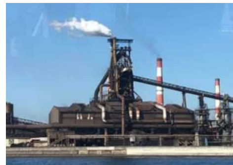
2023年9月に休止される扇島のJFE高炉

JFEスチール京浜製鉄所 の高炉休止(2023年9月) まで1年を切った10月、市は JFEの関連・下請事業者に、 高炉休止の影響等のアンケー ト調査を実施。1833社のうち 113社が回答しています。