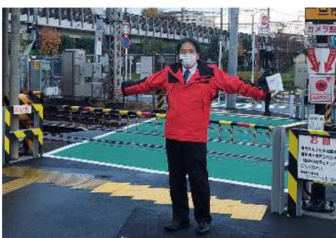
2倍の4.4mに広がりました

と質問。市から「京急との協定締結など準備を進める」との回答を得ていました。当初の予定より遅れていましたが、拡幅工事が11月16日に完了しました。